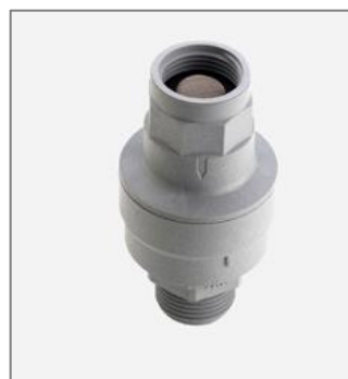
aquastop voor een wasmachine