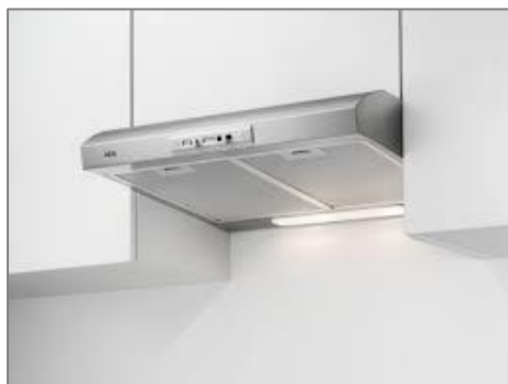
voorbeeld recirculatie afzuigkap