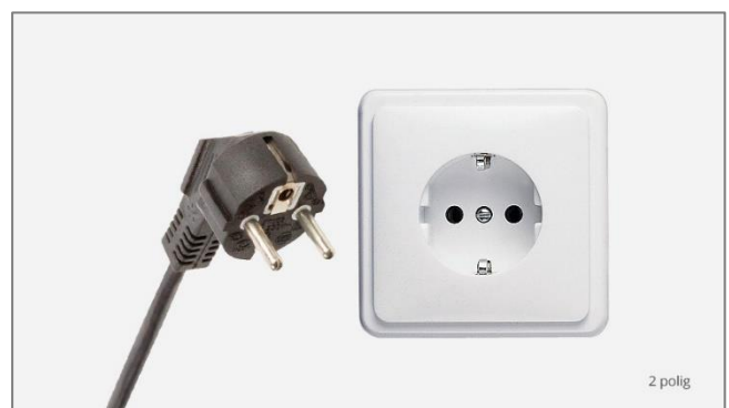
niet geschikt voor elektrisch koken